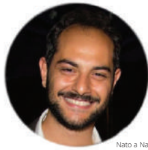
Nato a Napoli il 28-09-1988